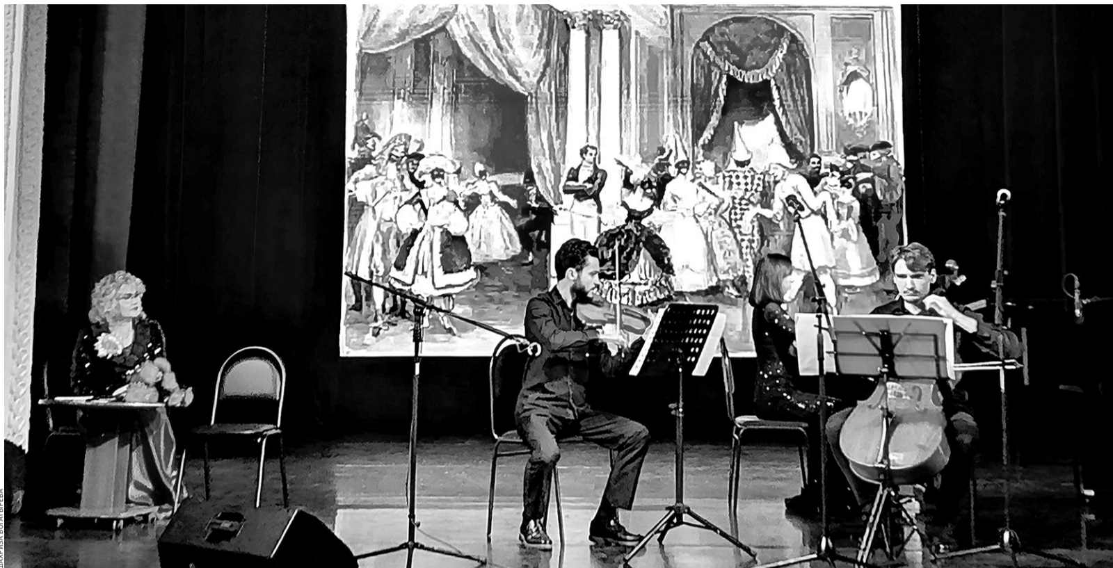
Фрагмент литературно-музыкального концерта