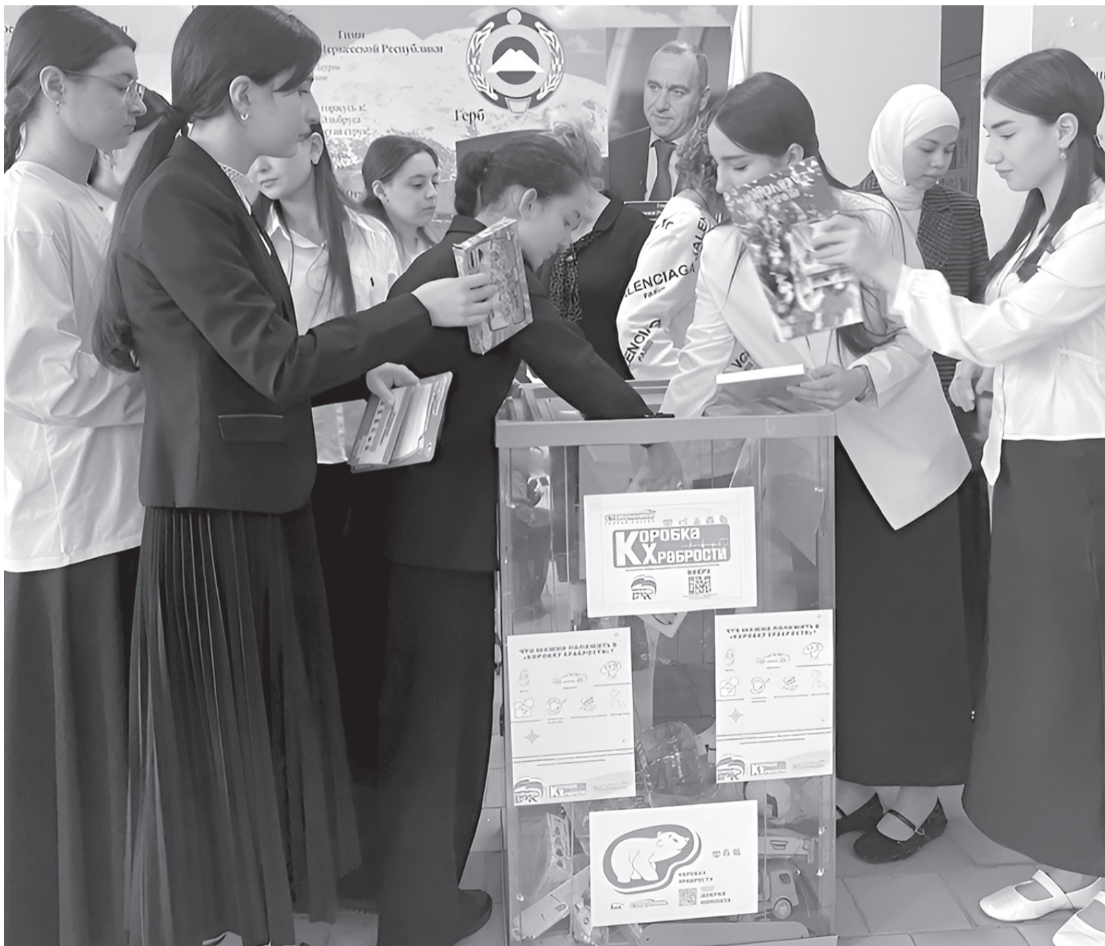
К благотворительной акции «Коробка храбрости» уже присоединился Усть-Джегутинский муниципальный район

«Единая Россия» дала старт благотворительной акции «Коробка храбрости»